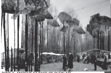
ZONE 3 - MARCHÉ ET BASE DE PLEIN AIR