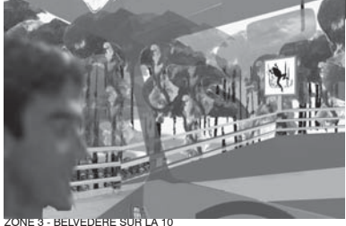
ZONE 3 - BELVEDÈRE SUR LA 10