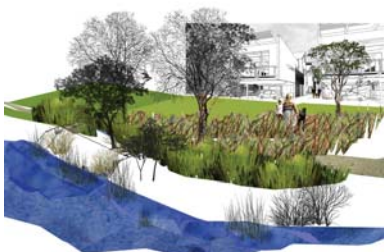
DÉVELOPPEMENT RÉSIDUEL INTÉGRÉ LE LONG DES BANDES RIVERAINES