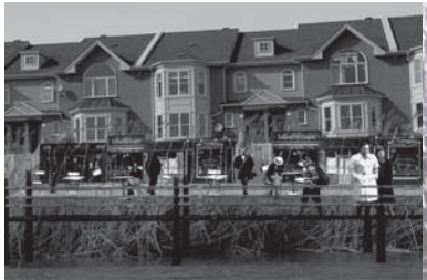
ZONE 1 - RIVES PUBLIQUES