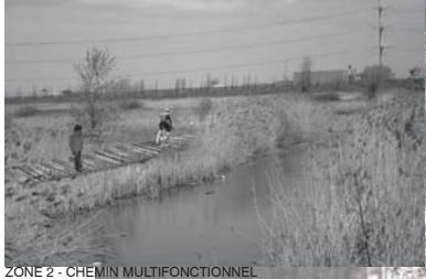
ZONE 2 - CHEMIN MULTIFONCTIONNEL