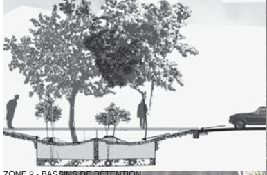
ZONE 2 - BASSINS DE RETENTION