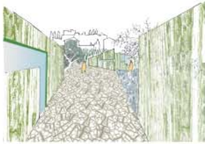
LIBIÈRE ENTRE LE PIEMONT ET WASTANI