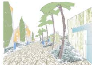
LIBIÈRE ENTRE WASTANI ET LA ZONE REMEMBRÉE