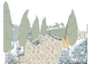
LIBIÈRE ENTRE DEUX GROUPES DE PARCELLES