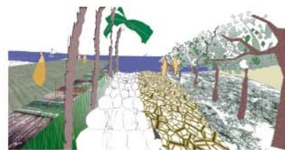
LA COULÉE VERS LA MER