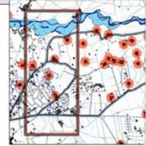
Zone de projet