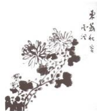
Chrysanthème, Artiste :Kim Yongmin Symbolism in Korean ink brush paintings