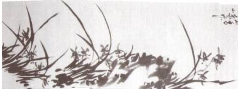
Orchidée, Artiste :Yun Chonghwa, Symbolism in Korean ink brush paintings