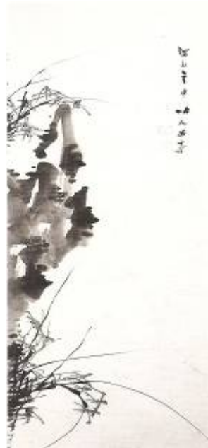
Artiste : Yi Ha-ung (1820-1898)

L'école du nord ou la peinture dite académique . Les traits sont fins et réfléchis et les couleurs sont plus étalées. Ce type de peinture sert surtout pour représenter des scènes extérieures. Les compositions sont harmonieuses et équilibrées; rien n'est laissé au hasard.