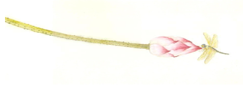
Artiste : Liliane Borodine, 2004, La symbolique de la peinture traditionnelle asiatique

Parfois, les images représentent deux choses différentes (générale ou spirituelle). Une fleur de lotus, par exemple, peut être considérée l'idéale de pureté en Bouddhisme ou être symbole de fertilité dans le contexte plus général. C'est pourquoi il est si important dans l'art coréen de comprendre les différents symboles. Cette association permet de créer des attaches entre le peuple, mais il sert principalement à comprendre l'art et à laisser celui-ci nous véhiculer un message.(Ken Vos)