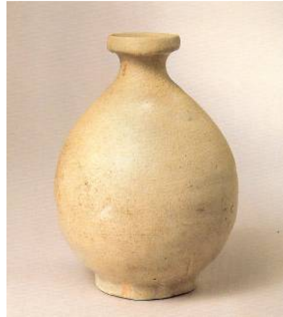
Bouteille verte, Période : 14 e et 15 e siècle, symbolism and simplicity

Le type de médium utilisé est un moyen efficace pour définir l'esthétique purement coréenne. Le papier teinté de façon naturelle, les supports de soie ou les tissus de textures plus brutes utilisées pour des images sophistiqués par exemple. Cet aspect de nouveauté pique la curiosité du spectateur qui se sent plus enveloppé par l'oeuvre. L'audace et la vitalité retrouvées chez l'artiste coréen montre sa capacité et sa volonté de se détacher des représentations généralement admises dans les arts de l'Asie de l'Est. Cette façon de représenter les choses est également commune dans la production de céramique. L'artisan coréen expose habituellement les traces de modes de production, laissant parfois l'objet à l'état brut pour ainsi venir intégrer la nature et le caractère original de l'objet en question. La finition d'un objet n'est pas nécessairement perçue comme un idéal de beauté chez les Coréens. Les imperfections sont fidèlement conservées pour établir une franchise visuelle et garder les liens naturels. Les artistes coréens ont l'habileté de traiter leurs oeuvres avec une sensibilité telle qu'ils savent parfaitement de quelle façon les laisser naturelles. (Pierre Cambon)