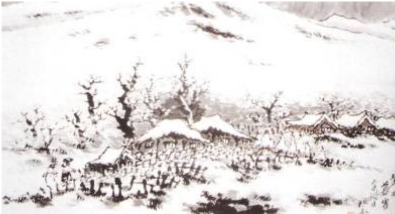
Personnages revenant à la maison dans la neige, Artiste : Kim Pyongnae Symbolism in Korean ink brush paintings

Neige : Dépendamment de l'intensité du noir de l'encre, la neige est symbole de silence. Elle illustre les paysages enchanteurs.