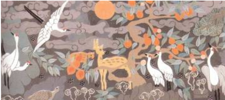
Les dix symboles de longévité, Artiste : anonyme, Symbolism in Korean ink brush paintings

typiquement coréen. Selon le peuple, les dix symboles peuvent réellement donner des pouvoirs de longévité :