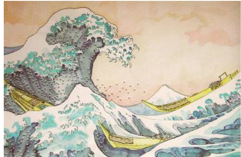
Artiste : Liliane Borodine, 2004 La symbolique de la peinture traditionnelle asiatique

Les artistes aiment jouer avec les compositions décentrées, les cadres flous, les diagonales... L'image nous rappelle souvent une photographie, les zooms, les gros plans, les cadrages décalés et les premiers plans très souvent mis en évidence. Il y a également un immense rapprochement entre la calligraphie et la peinture. C'est en fait le jeu du pinceau qui vient ici jouer un rôle important dans les représentations. L'approche des choses de la nature est simple mais à la fois tellement réaliste. Le but premier est de recréer l'univers qui entoure les artistes. On veut recréer et représenter le monde tel qu'il est réellement. L'approche est donc très sensible, personnelle et intime. Malgré le fait que les artistes veulent ici recréer la nature et leur environnement, le spectateur doit être capable de saisir l'image. Il doit reconnaître le message et non lire la peinture. C'est pourquoi, très souvent, l'impact visuel est majoritairement maximisé.