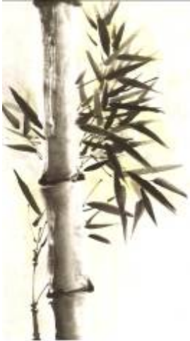
Artiste : Liliane Borodine, 2004, La symbolique de la peinture traditionnelle asiatique

Il y a également le goût de la nature qui reste figé dans les compositions coréennes. Cette saveur d'origine chinoise se transcrit à travers les peintures de paysages coréens. Les compositions coréennes ont des particularités bien définies. Les montagnes se dressent à travers les nuages, les pins surgissent de nulle part. L'artiste a une façon bien à lui de suggérer l'histoire, il va droit au but. Les charpentes picturales sont fabriquées et disposées de façon brutale; l'efficacité, la rapidité et l'abstraction sont les techniques privilégiées. Le spectateur reconnaît habituellement assez rapidement le sujet, il est projeté visiblement dans la scène. Par exemple, un bambou est dessiné sur une feuille de façon à ce qu'il émerge d'un coin et en ressort intensément de l'autre, laissant ainsi une majeure partie de la feuille libre.