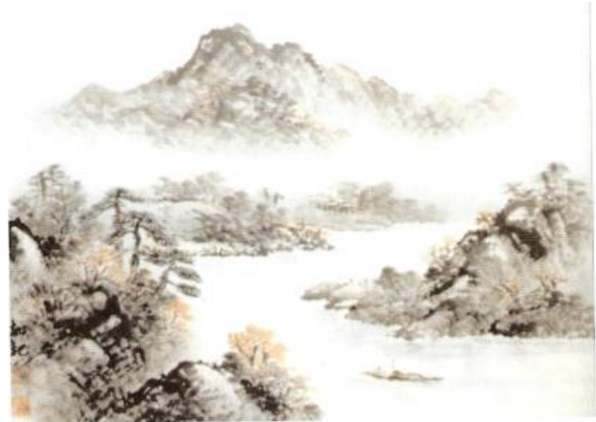
Eau et montagnes, automne, Artiste : Cho Hyondae, Symbolism in Korean ink brush paintings

Depuis toujours, les civilisations ont été concernées par l'image de l'eau. Sans l'eau, il n'y a pas de vie et l'eau est une grande partie de ce qui constitue le paysage. C'est pourquoi les représentations incluant de l'eau et des montagnes sont si populaires en Asie. En Asie de l'Est, l'esprit de l'eau était représenté par un dragon. Différents types de dragons existaient; certains habitaient dans la mer, certains dans les rivières et d'autres tout simplement dans les nuages. Selon eux, l'eau avait des pouvoirs nettoyants; elle procurait la santé et éloignait les maladies puisqu'elle était transparente; elle était aussi spirituelle. De plus, elle reflète comme un miroir, c'est donc signe qu'elle nous présentait un nouveau monde.