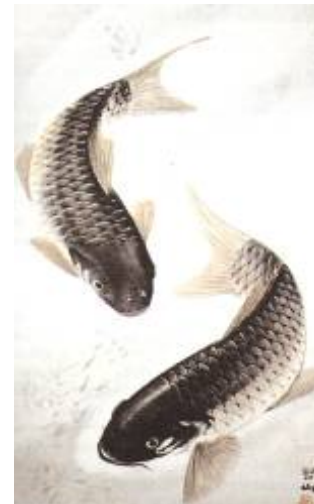
Deux carpes, Artiste : Kwon Unt'aek, Symbolism in Korean ink brush paintings

Carpe : Elle permet d'éloigner les mauvais esprits et représente la longévité. La carpe remonte les rivières en luttant avec courage et persévérance, c'est donc symbole d'endurance et de force.