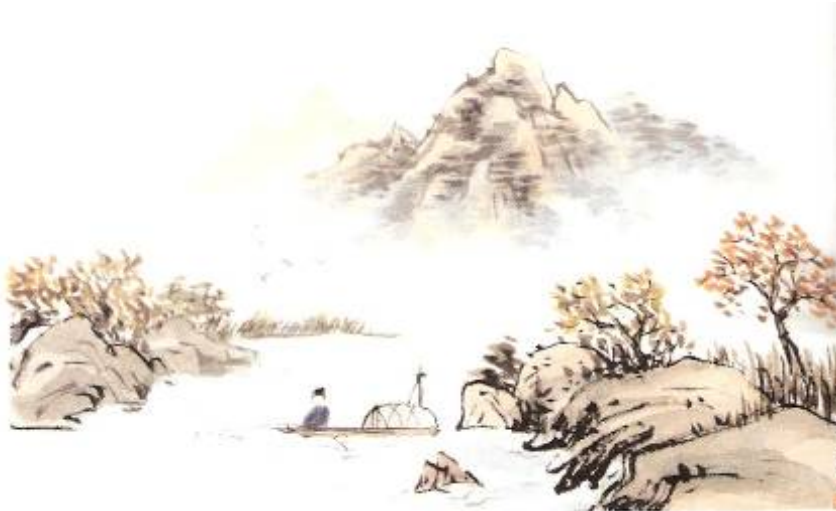
Pêche sur le lac en automne, Artiste : Chong Munyong, Symbolism in Korean ink brush paintings

La Corée est reconnue pour dessiner l'homme d'une façon microscopique. Pourtant, celui-ci est considéré comme l'élément central de la peinture coréenne. Il est en fait situé au même niveau que la terre et le paradis. L'exagération de la taille de l'homme est simplement une amplification de la réalité. L'homme est effectivement très minuscule comparativement à l'environnement qui l'entoure. Selon la culture coréenne, les artistes n'ont pas besoin de faire une grande place picturale à l'image de l'homme car celui-ci est présent en permanence dans l'œuvre. Il est le spectateur, celui qui vit l'œuvre et il est l'artiste celui qui la conçoit. (Francis Mullany)