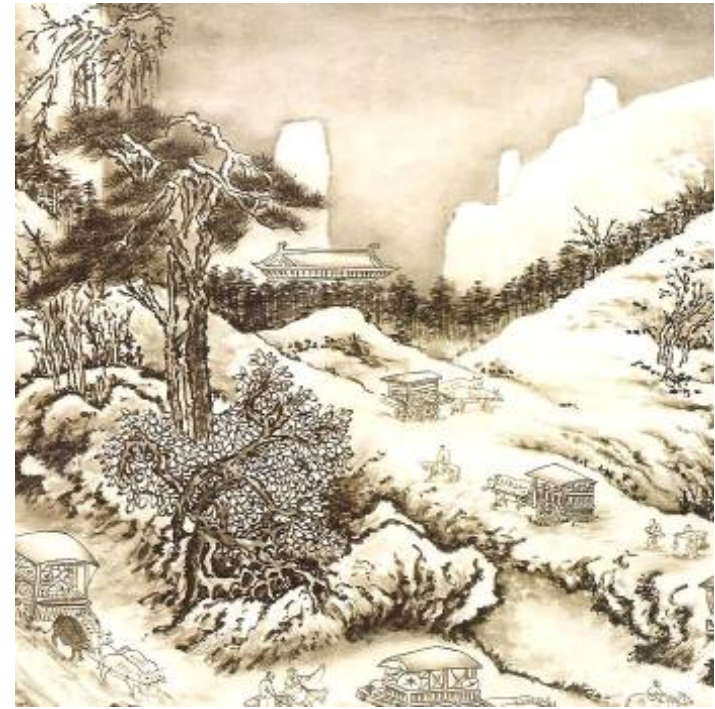
Artiste : Liliane Borodine 2004 La symbolique de la peinture traditionnelle asiatique

L'école du nord ou la peinture dite académique . Les traits sont fins et réfléchis et les couleurs sont plus étalées. Ce type de peinture sert surtout pour représenter des scènes extérieures. Les compositions sont harmonieuses et équilibrées; rien n'est laissé au hasard.