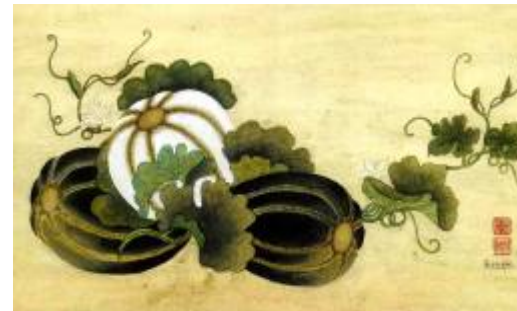
Pastèque, Artiste : Liliane Borodine, 2004, La symbolique de la peinture traditionnelle asiatique

Pastèque : Symbole de fécondité et ce, en raison de ses nombreux pépins.