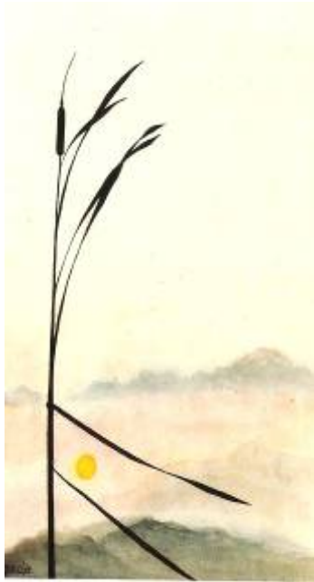
Artiste : Liliane Borodine, 2004 La symbolique de la peinture traditionnelle asiatique

La Corée s'est toujours inspirée de la Chine dans le domaine des arts. Cette civilisation a toutefois continuellement su recréer la Chine, mais d'une manière beaucoup plus personnelle. Les Coréens s'inspirent des deux différentes écoles. L'école du sud , ou peinture spontanée et monochrome . Ce genre de peinture sert principalement à faire naître des émotions et des idées. L'image est plus libre et plus spontanée.