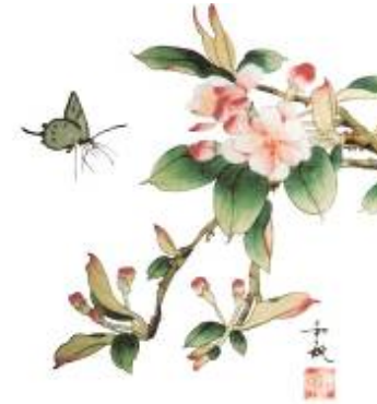
Prunier en fleur, Artiste : Hwa Min Symbolism in Korean ink brush paintings