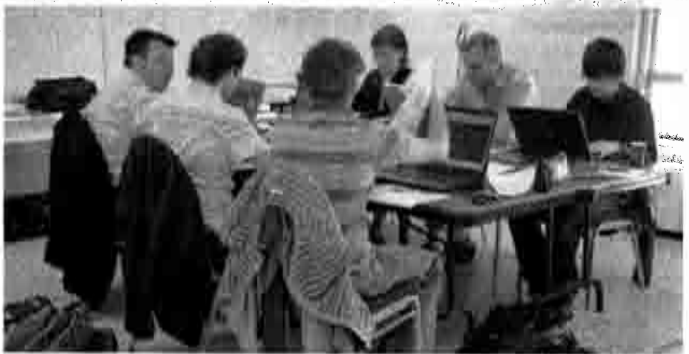
Les universitaires spécialistes en aménagement en plein travail.

min de Chambly et des voies ferrées, des éléments de franchissement sont prévus. Deux passerelles piétonnes et cyclistes seraient érigées et un pont vert relierait les quartiers situés de part et d'autre de la voie ferrée.