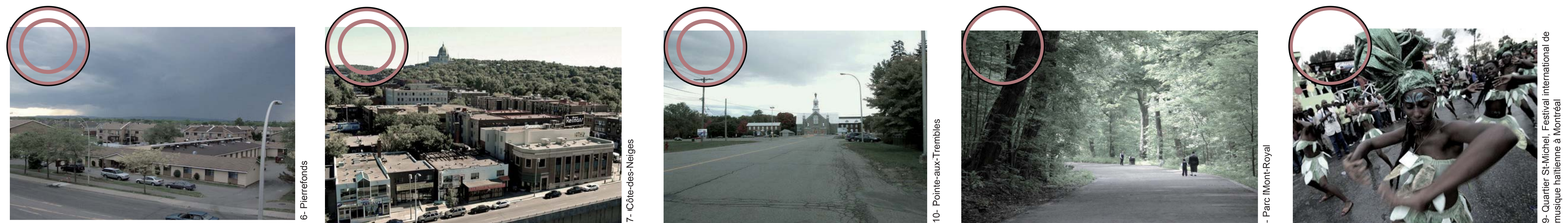
Un manque se fait sentir dans la répartition des parcours urbains à l'échelle de l'île de Montréal. Les territoires ciblés sont les secteurs résidentiels à l'est et à l'ouest du centre-ville, ainsi que dans les quartiers d'immigration.