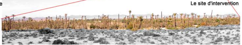
Le site d'intervention

Ainsi, le jardin nourricier de Marrakech, la base de la culture Marocaine, disparaîtra sous peu si rien n'est fait.