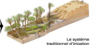
Le système traditionnel d'irrigation